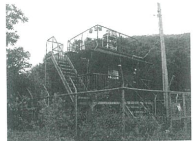
国設赤城酸性雨観測所