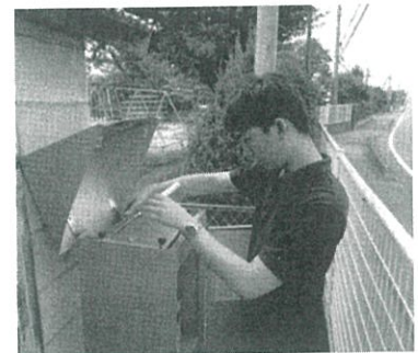
有害大気汚染物質調査