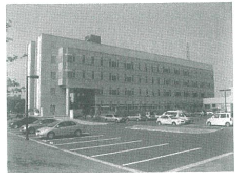
群馬県衛生環境研究所