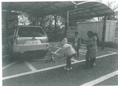
体験型大気環境学習の様子