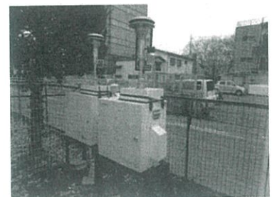
PM 2.5 調査