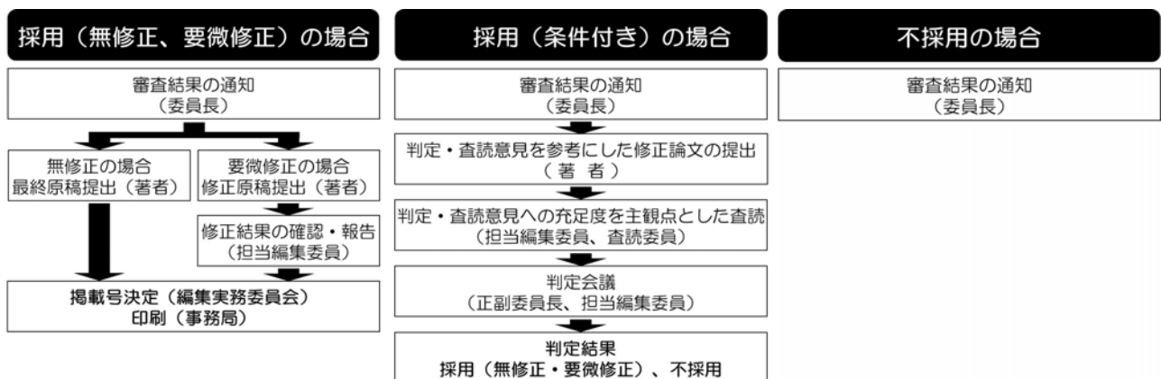
図2 審査判定後の手順